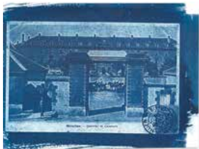
Quartier Villars – cyanotype