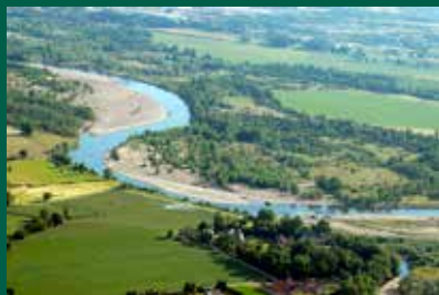
Méandre de l'Allier, Bressolles