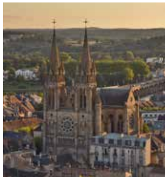
Église du Sacré-Cœur, Moulins