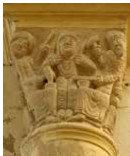
Chapiteau des monnayeurs, prieurale de Souvigny

RDV à l'amphithéâtre S4 de la salle des fêtes de Moulins.