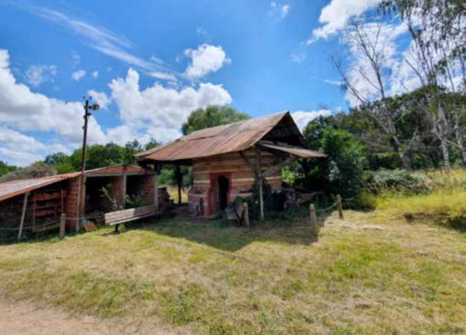
Tuilerie de Bomplein, Couzon