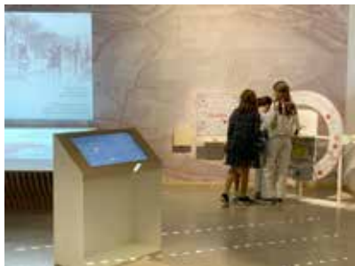
Espace patrimoine, Maison de la Rivière Allier

Le site est accessible aux personnes à mobilité réduite.