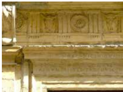
Maison Lorin des Barres Moulins. Frise Renaissance, détail.

RDV à l'amphithéâtre S4 de la salle des fêtes de Moulins.