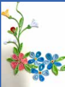
Atelier Mes Paperolles