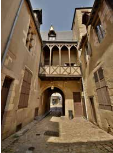
Cour intérieure, hôtel Demoret

4, route de Clermont 03000 Moulins patrimoine.mdlra@agglo-moulins.fr Tél : 04 63 83 34 12