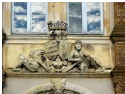
Détails, hôtel de Chavagnac