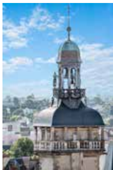
Jacquemart, beffroi de Moulins