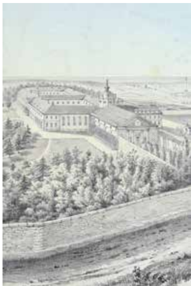
Église et monastère de la Visitation de Boulogne

Fermeture annuelle : 25 décembre et mois de janvier.