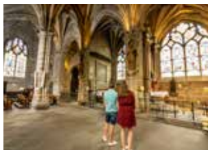
Cathédrale de Moulins