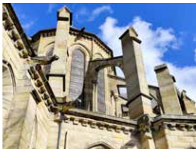
Église du Sacré-Cœur, Moulins

Le jeudi 27 novembre à 18h30. RDV à l'amphithéâtre S4 de la salle des fêtes de Moulins.