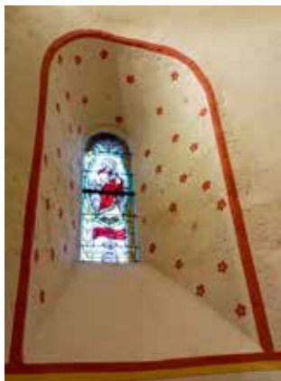
Décor peint église de Chapeau, restauration 2024