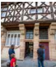
Quartier historique, Moulins