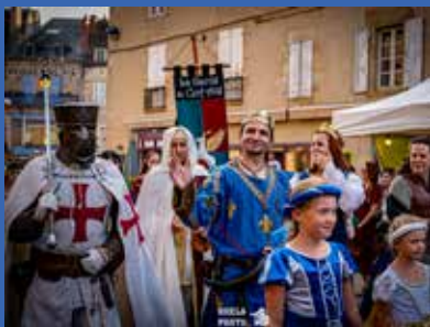
Atelier Apprenti chevalier