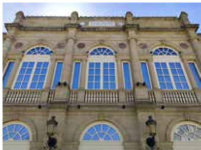
Théâtre de Moulins