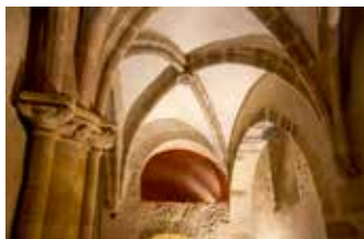
Caves Bertine, Moulins