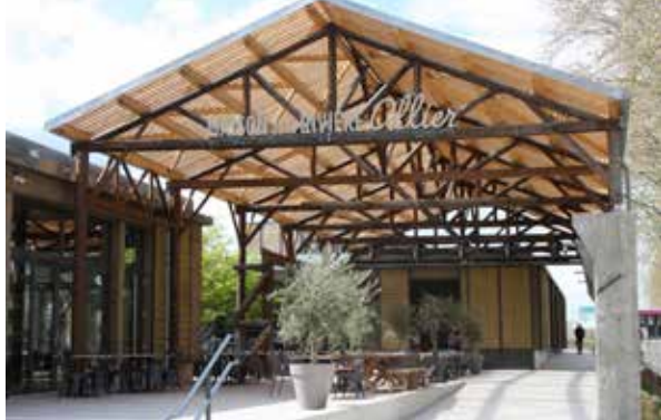
Maison de la Rivière Allier