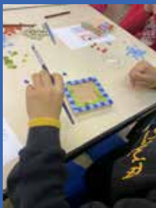
Atelier Apprenti mosaïste