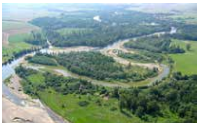
Méandre de l'Allier