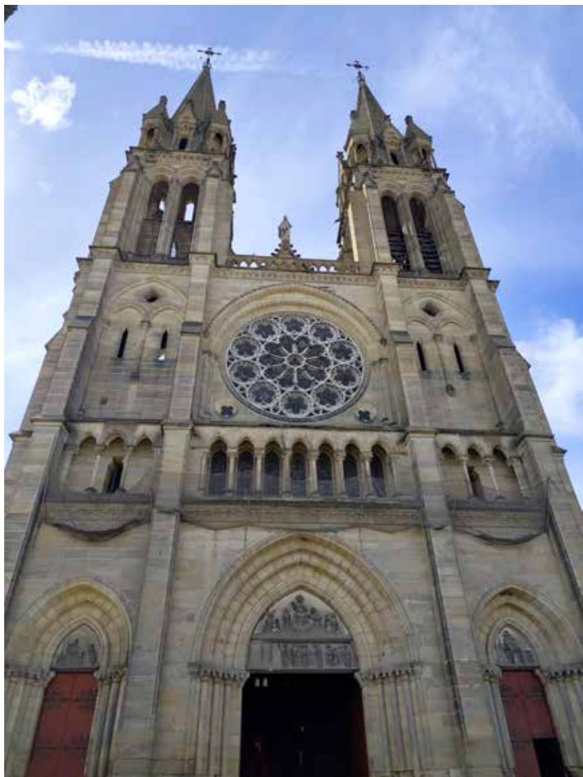
Église du Sacré-Coeur, Moulins