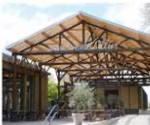
Espace patrimoine Maison de la Rivière Allier