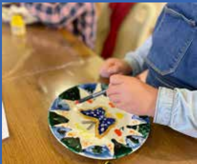
Atelier Mon assiette