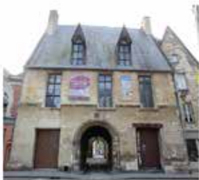
Espace patrimoine Hôtel Demoret